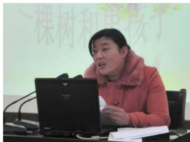
体育考试那天，老天爷不知闹什么情绪，风一直从早上刮到下午。作为班主任，我早上六点钟就起床，提前赶到考试地点等候学生。考前热身活动，考前思想动员，考前分组排号，直至把所有学生送进考场内，我还没来得及喘口气，又得为每组学生加油鼓劲，喊破了嗓子，吼尽了力气。体育考完，又得为下午的音乐考试准备。提前到场，安抚学生，强化练习，耐心等待，直至最后一名学生出来，我都有些虚脱。可一想到第二天的考试，这到了关键时刻，哪一项考试失误，不都关系着或是金榜题名，抑或是名落孙山。我赶紧联系化学老师，看能不能让班里的种子选手在考前再多做一遍实验。匆匆赶回学校，安排好一切，做实验，看学生。等一切都尘埃落地，我也累的筋疲力竭，连一句话都不想说。这班主任当得，挣得是卖白菜的钱，操的是卖白粉的心。

骑上车，我只想赶快回到家，洗个热水澡，美美地睡上一觉。讨厌的风还在一个劲地刮，我一边咒骂着，一边使劲的往前赶。远远的前面聚集了两个人，心想：“又是哪个倒霉的制造了交通事故，这不是成心添乱吗？还嫌大街不够拥挤。”本来我就不就是个爱凑热闹的，何况现在这心情，我匆匆瞥了一眼就疾驰而过。大概往前骑行了十几米，忽然觉得刚才一堆人里有一个是我的学生，会不会是她出了什么事？我略迟疑了一下，扭回头毫不犹豫的骑到出事地点。