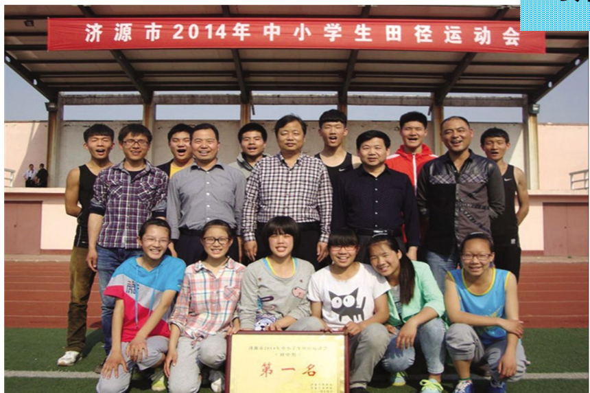
▲ 在济源市2014年济源市中小學生田径运动会上我校以绝对优势再次获得初中组团体第一名，实现了三连冠。