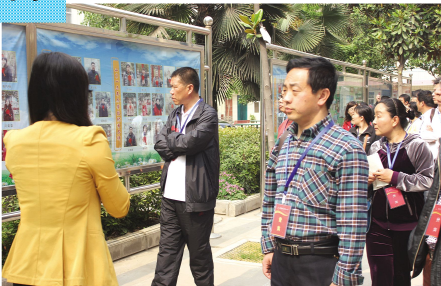
▲ 5月9日，汤阴县实验中学一行60余人到我校参观学习。